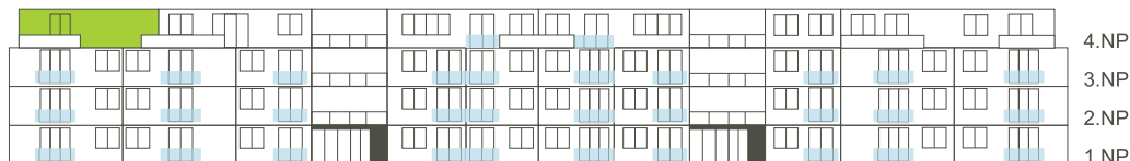
Východní pohled na dům/ Building View - East side